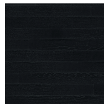
Viva Line Tammi Black

Puu on luonnon materiaali, jossa esiintyy vaihtelua. Mallikuvien värit ja pinnan kuviot ovat viitteellisiä. Saat kattavamman käsityksen ottamalla yhteyttä jälleenmyyjään tai käymällä osoitteessa www.tarkett.fi . Myymälöissä voit tutustua Tarkettin lajitelmakuvakirjaan (grading book) ja aitoihin puunäytteisiin. Yksittäinen näyte on kuitenkin vain esimerkki siitä, miltä lattia voi näyttää. Jotta saat käsityksen koko lattian väri vaihteluista, oksankohtien määrästä ja muista ominaisuuksista, tutki useita lautoja tai tutustu lajitelmakuvakirjaan. Tämä on erityisen tärkeää, kun kyseessä on lankkullattia tai sävytetty lattia.