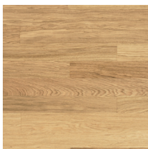
Viva Line Tammi (harjattu)