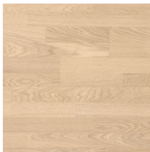
Viva Tammi White