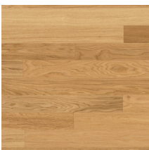
Viva Line Tammi