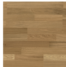
Viva Tammi (2-s)