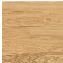
Viva Tammi (1-s)