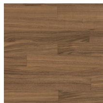
Viva Line Pähkinä