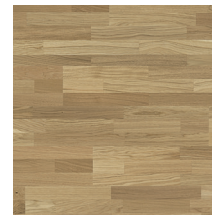
Viva Tammi (3-s)